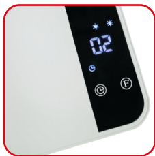
Display digitale con LED blu Digital display with blue LED

Perfect for the bathroom, it is wall-mounted and can be remotely controlled with the supplied remote control. The open window sensor prevents waste and dispersion of energy and heat. It is aesthetically pleasing and, thanks to its enveloping lines, it is suitable for any environment.