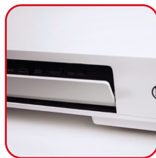
Oscillazione automatica flap Automatic swing of the flap