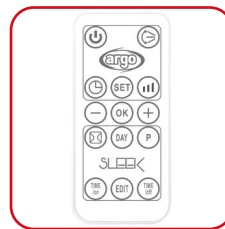
Telecomando slim a infrarossi Slim infrared remote control